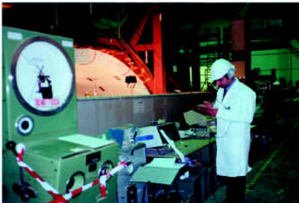
TRL 试验: 从 20 吨到 45 吨。

我们在运行中的桥梁上以及位于伦敦附近的运输研究实验室里进行了大规模的试验。从左边的示意图可以看到，在这个加固的模型中最高载荷点是20吨。通过CINTEC加固锚, 安装在采用了最新科技设计精确定位的部位，该模型的载荷点承重提高到45吨。