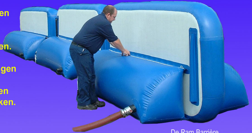
De Ram Barrière

Ze kunnen opgeblazen blijven in omgevingen waar de aanwezigheid van verdachte voorwerpen vermoed wordt, of opgeborgen worden om ze waar en wanneer te gebruiken.