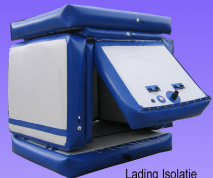
Lading Isolatie Systeem